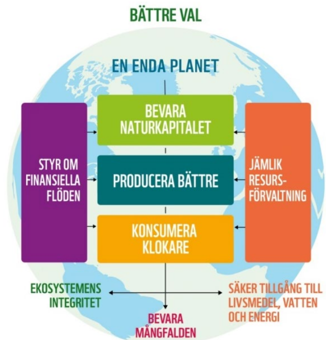
Figur 1: WWFs förändringsteori sammanfattas i denna schematiska bild över vad som krävs för att nå WWFs övergripande vision.